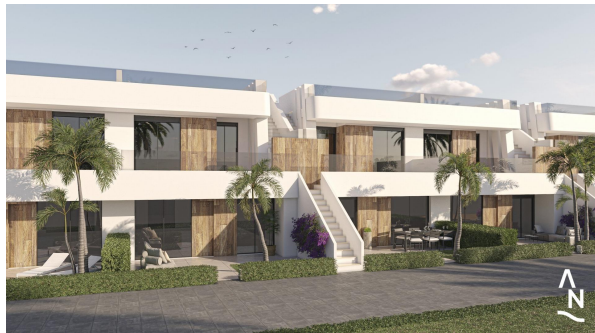
BUNGALOW TIPO B Vivienda 02-01-06-08