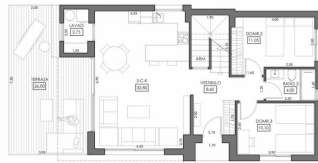
ESCALA GRAFICA 0 2 4 6 METROS