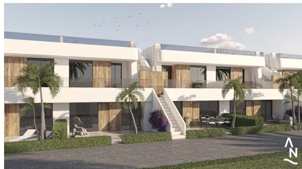
BUNGALOW TIPO B Vivienda 02-01-06-08