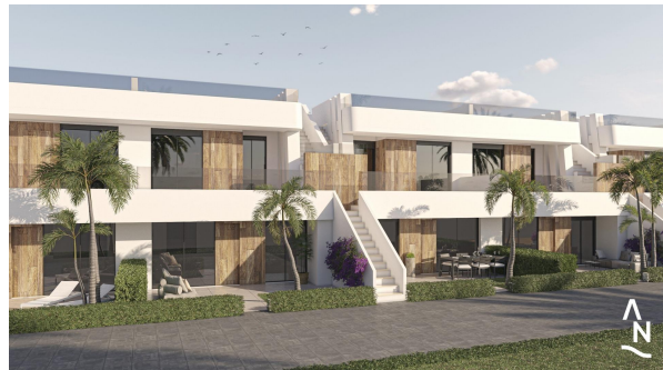
BUNGALOW TIPO B Vivienda 02-01-06-08