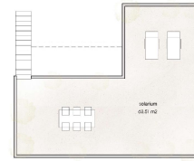
P1 / FIRST FL