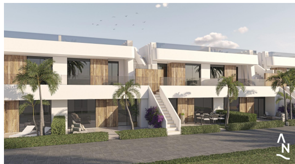
BUNGALOW TIPO B Vivienda 02-01-06-08